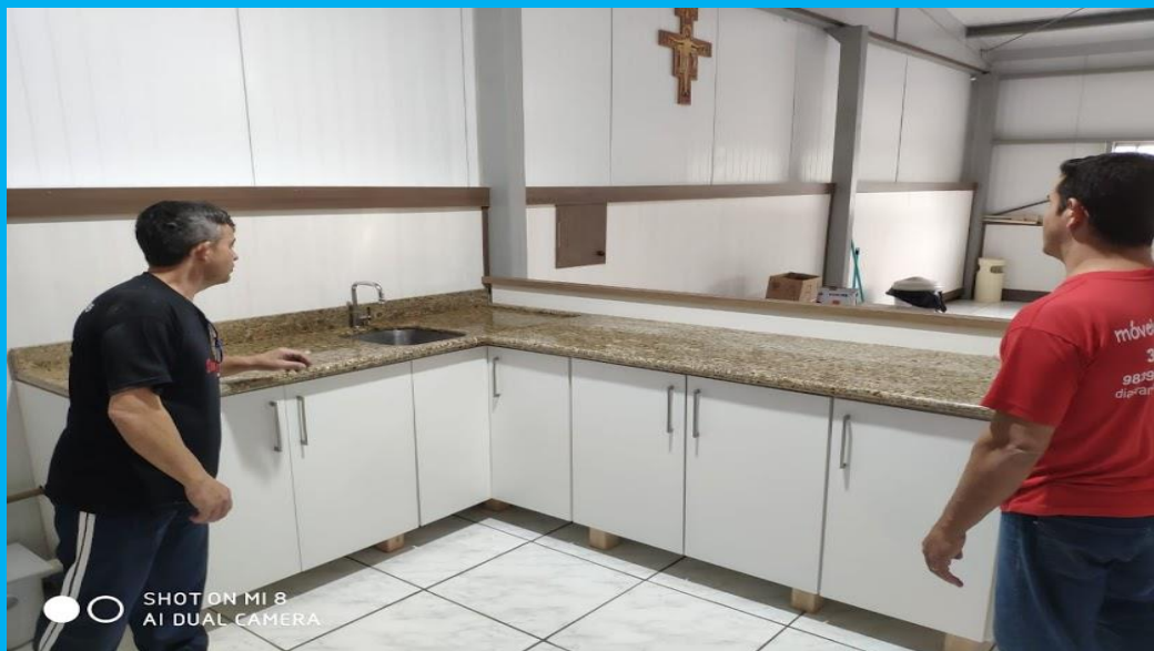
CPCA recebe copa no refeitório para auxiliar na lavagem dos utensílios do refeitório