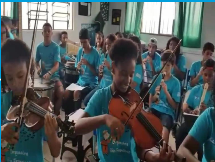
Orquestra São Francisco ( acima ) e