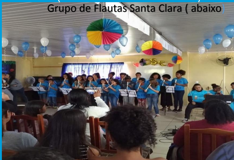
Grupo de Flautas Santa Clara ( abaixo )